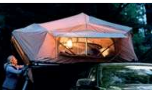
Lều gắn nóc ARB