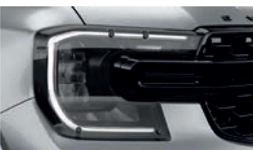
Ốp đèn trước