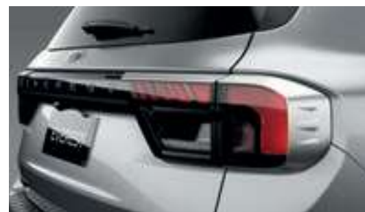
Ốp đèn hậu