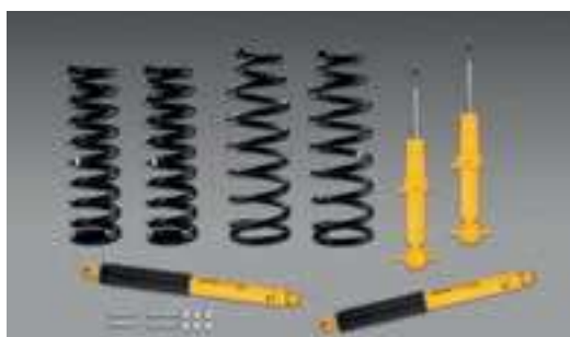
Phụ tùng sau OME Everest sau 2022