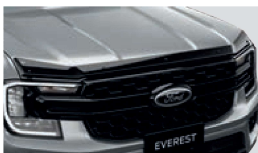
Ốp nắp capo