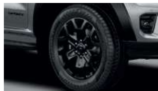
Ốp cua lốp