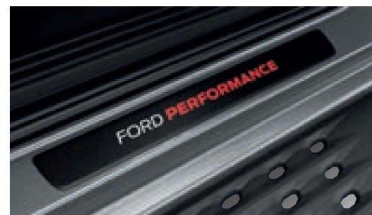
Ốp bậc cửa