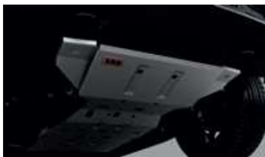
Giáp gầm ARB