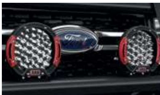
Đèn Led ARB hiệu suất cao