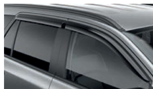
Vè che mưa