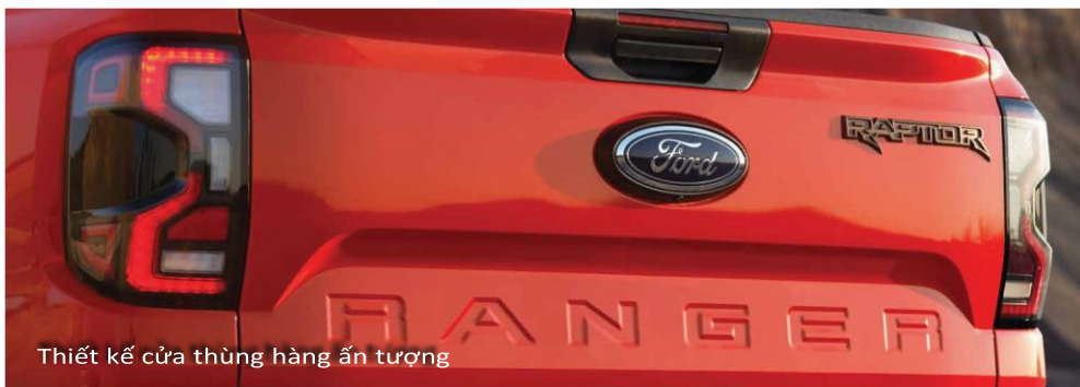
Thiết kế cửa thùng hàng ấn tượng

Hệ thống khung gầm mới được gia cố vững chắc hơn. Hệ thống treo tay đòn kép phía trước cùng hệ thống treo sau với thanh ổn định liên kết kiểu Watts được cải tiến giúp Ranger Raptor Thế hệ Mới nhẹ nhàng vượt qua các địa hình off-road khắc nghiệt nhất.