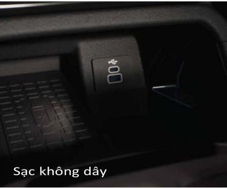
Sạc không dây