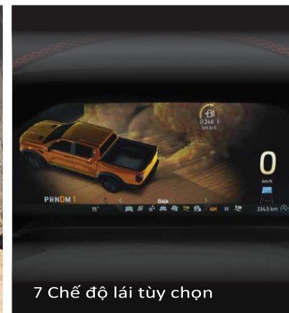
7 Chế độ lái tùy chọn