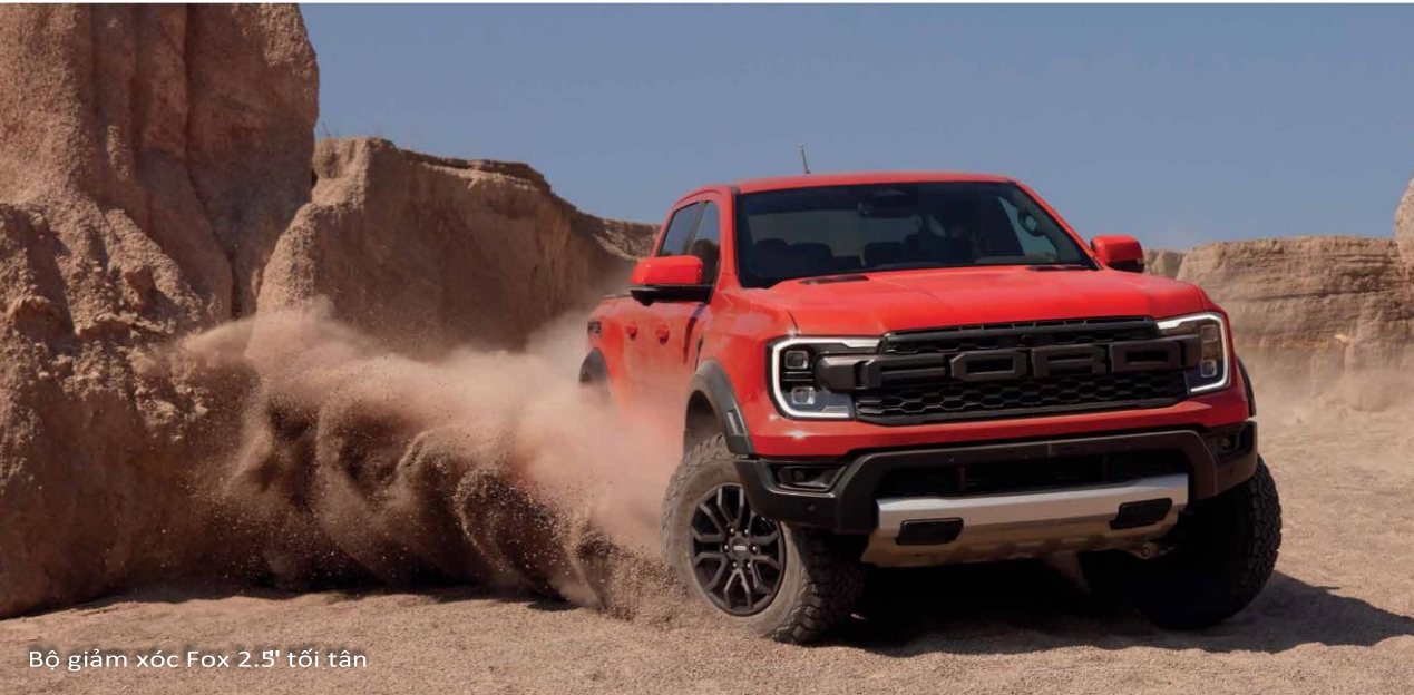
Bộ giảm xóc Fox 2.5' tối tân