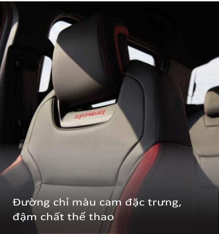
Đường chỉ màu cam đặc trưng, đậm chất thể thao