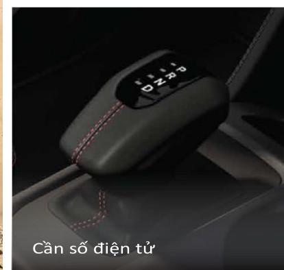
Cần số điện tử