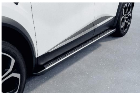
FOTSTEG (exkl. monteringskostnad)