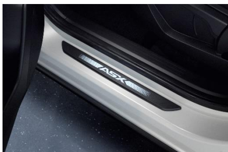
INTEGSSKYDD MED BELYSNING (exkl. monteringskostnad)