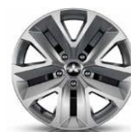
17" flexfälgar Stålfälgar navkapsel 205/55 R17