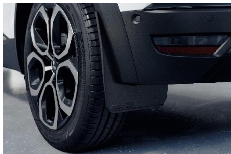
STÄNKSKYDD FRAM ELLER BAK