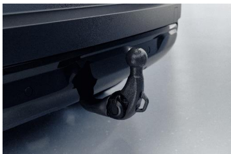
INFÄLLBAR DRAGKROK (exkl. monteringskostnad)