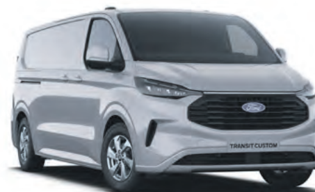
GREY MATTER - LAKIER ZWYKŁY SPECJALNY 2 750,- | lakier niedostępny dla wersji TREND