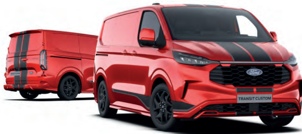
NOWY FORD TRANSIT CUSTOM VAN W WERSJI SPORT Z LAKIEREM METALIZOWANYM ARTISAN RED (OPCJA)