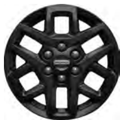
16" OBRĘCZE ZE STOPÓW LEKKICH Standard dla wersji TRAIL