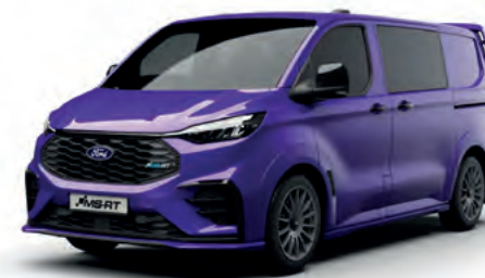
ENW PURPLE - LAKIER SVO 2 500,- | lakier dostępny tylko dla wersji MS-RT