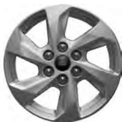
16" OBRĘCZE ZE STOPÓW LEKKICH 450,- dla wersji TREND Standard dla wersji LIMITED