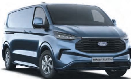
CHROME BLUE - LAKIER METALIZOWANY 2 750,- | lakier niedostępny dla wersji TRAIL i MS-RT