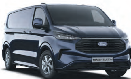
BLAZER BLUE - LAKIER ZWYKŁY BEZ DOPLĄTY | lakier dostępny tylko dla wersji TREND