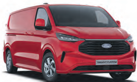
ARTISAN RED - LAKIER METALIZOWANY 2 750,- | lakier niedostępny dla wersji TREND i TRAIL