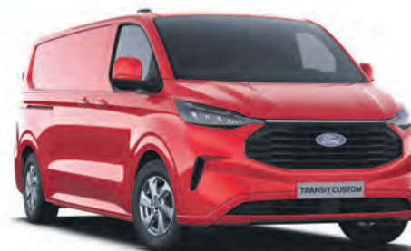
RACE RED - LAKIER ZWYKŁY BEZ DOPLĄTY | lakier dostępny tylko dla wersji TREND