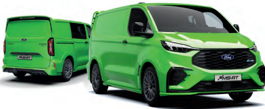
NOWY FORD TRANSIT CUSTOM VAN W WERSJI MS-RT Z OPCJONALNYM WYPOSAŻENIEM (TYLNA KLAPA) ORAZ LAKIEREM SPECJALNYM GREEN YELLOW (OPCJA)