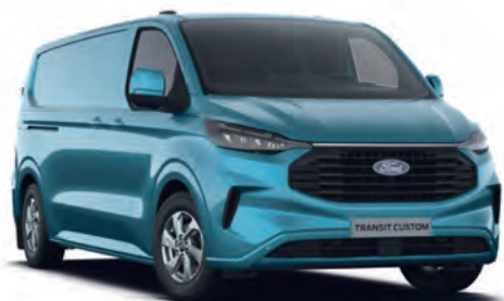
DIGITAL AQUA BLUE - LAKIER ZWYKŁY 2 750,- | lakier niedostępny dla wersji TRAIL. Dla wersji TREND dostępny tylko z napędem elektrycznym