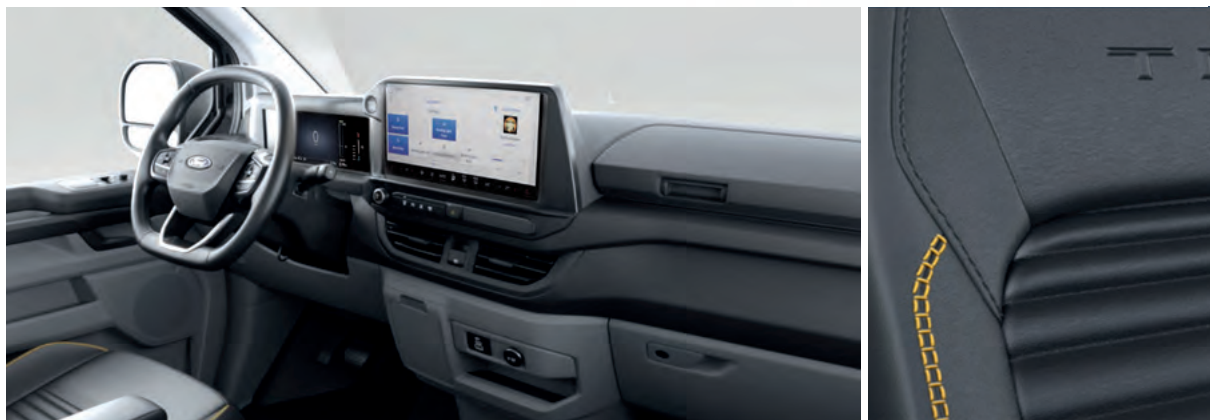
NOWY FORD TRANSIT CUSTOM VAN W WERSJI TRAIL Z AUTOMATYCZNĄ SKRZYNIĄ BIEGÓW I TAPICERKĄ CZĘŚCIOWO SKÓRZANĄ (SENSICO) W STYLIZACJI TRAIL, Z ŻÓŁTYMI AKCENTAMI (STANDARD)