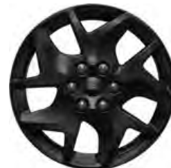
17" OBRĘCZE ZE STOPÓW LEKKICH Standard dla wersji SPORT