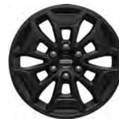
17" OBRĘCZE ZE STOPÓW LEKKICH 1 000,- dla wersji TRAIL