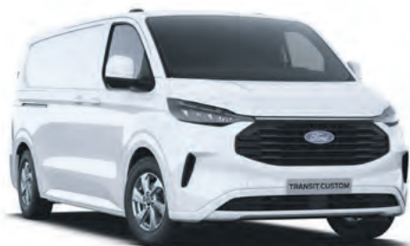
FROZEN WHITE - LAKIER ZWYKŁY BEZ DOPLĄTY