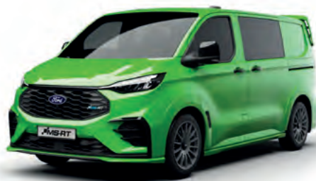
YELLOW GREEN - LAKIER SVO 2 500,- | lakier dostępny tylko dla wersji TREND i MS-RT