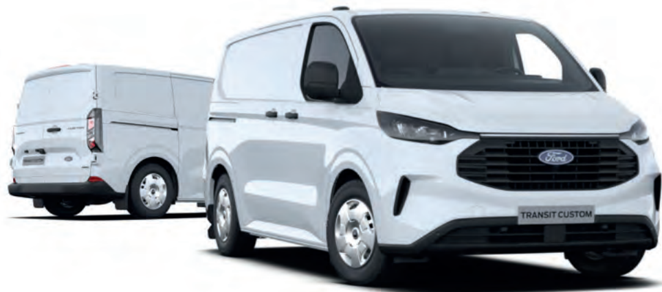
NOWY FORD TRANSIT CUSTOM VAN L1 W WERSJI TREND Z LAKIEREM ZWYKŁYM FROZEN WHITE (BEZ DOPŁATY)