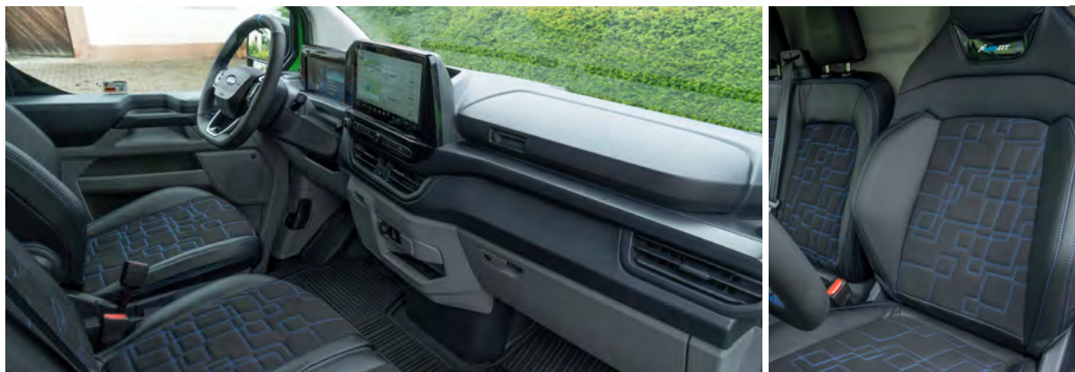
NOWY FORD TRANSIT CUSTOM VAN W WERSJI MS-RT Z AUTOMATYCZNĄ SKRZYNIĄ BIEGÓW I TAPICERKA CZĘŚCIOWO SKÓRZANA, POŁĄCZONA Z ZAMSZEM (STANDARD)