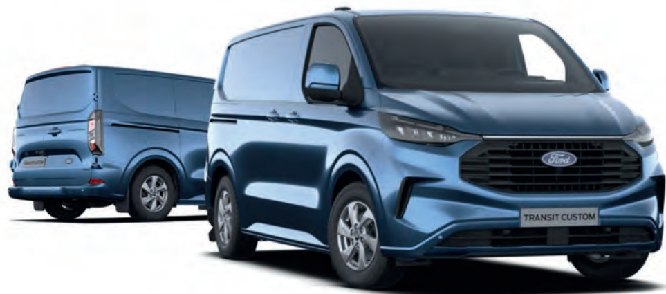
NOWY FORD TRANSIT CUSTOM VAN L1 W WERSJI LIMITED Z LAKIEREM METALIZOWANY CHROME BLUE (OPCJA)