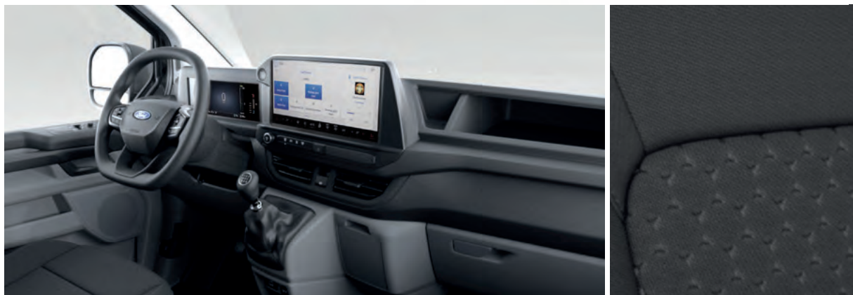
NOWY FORD TRANSIT CUSTOM VAN W WERSJI TREND Z MANUALNĄ SKRZYNIĄ BIEGÓW I TAPICERKĄ MATERIAŁOWĄ - CIEMNĄ (STANDARD)