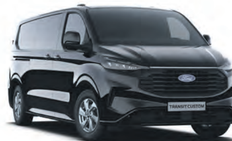
AGATE BLACK - LAKIER METALIZOWANY 2 750,-