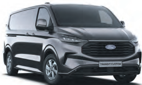
MAGNETIC GREY - LAKIER METALIZOWANY 2 750,-