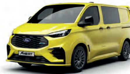
CADMIUM YELLOW - LAKIER SVO 2 500,- | lakier dostępny tylko dla wersji TREND i MS-RT