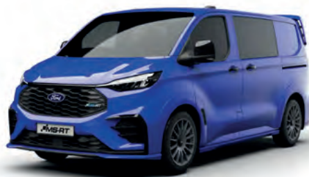
ULTRAMARINE BLUE - LAKIER SVO 2 500,- | lakier dostępny tylko dla wersji TREND i MS-RT