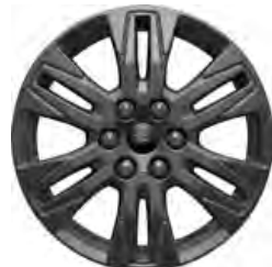
17" OBRĘCZE ZE STOPÓW LEKKICH 550,- dla wersji LIMITED