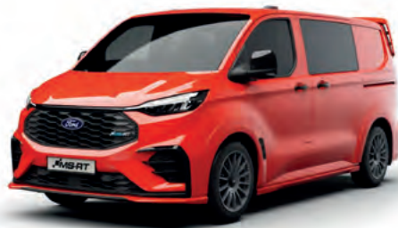
TNT TANGO ORANGE - LAKIER SVO 2 500,- | lakier dostępny tylko dla wersji TREND i MS-RT