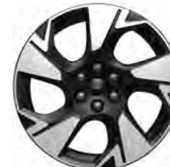
19" OBRĘCZE ZE STOPÓW LEKKICH 1 000,- dla wersji SPORT