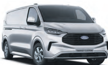
MOONDUST SILVER - LAKIER METALIZOWANY 2 750,- | lakier niedostępny dla wersji MS-RT