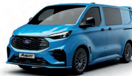
MS-RT BLUE - LAKIER SVO 2 500,- | lakier dostępny tylko dla wersji MS-RT