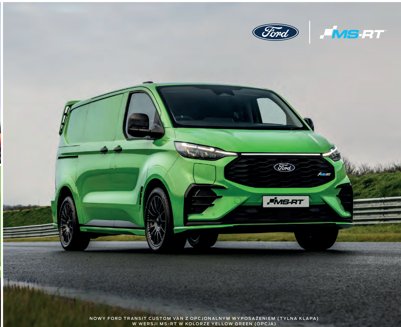
NOWY FORD TRANSIT CUSTOM VAN Z OPCJONALNYM WYPOSAŻENIEM (TYLNA KLAPA) W WERSJI MS-RT W KOLORZE YELLOW GREEN (OPCJA)