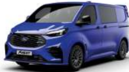
ULTRAMARINE BLUE - LAKIER SVO

2 500 zł | lakier dostępny tylko dla wersji TREND i MS-RT