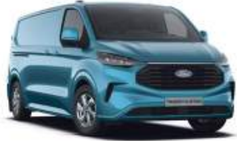
DIGITAL AQUA BLUE - LAKIER ZWYKŁY

2 750 zł | lakier niedostępny dla wersji TRAIL. Dla wersji TREND dostępny tylko z napędem elektrycznym