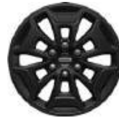
17" OBRĘCZE ZE STOPÓW LEKKICH 1 000 zł dla wersji TRAIL