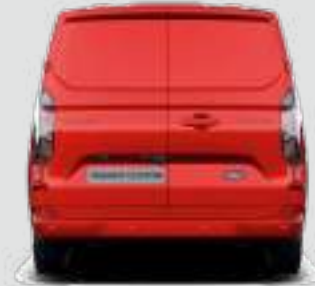
2148 mm (ZE ZŁOŻONYMI LUSTERKAMI)