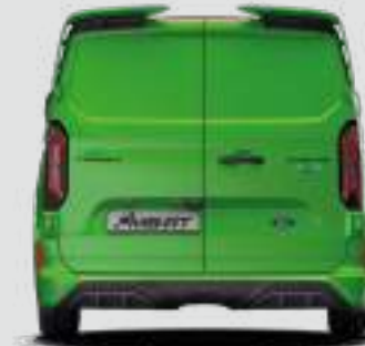
2275 mm (Z LUSTERKAMI)