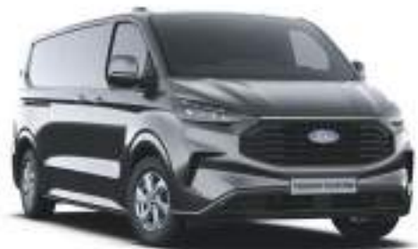
MAGNETIC GREY - LAKIER METALIZOWANY 2 750 zł