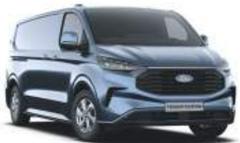
CHROME BLUE - LAKIER METALIZOWANY 2 750 zł | lakier niedostępny dla wersji TRAIL i MS-RT