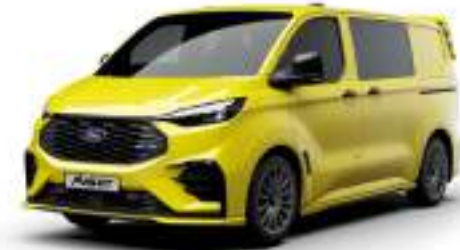
CADMIUM YELLOW - LAKIER SVO

2 500 zł | lakier dostępny tylko dla wersji TREND i MS-RT