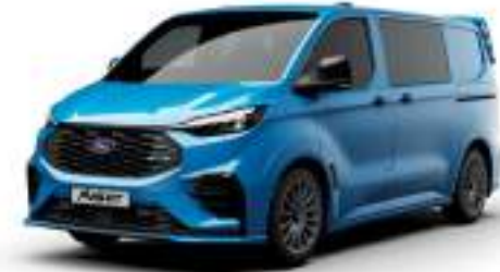
MS-RT BLUE - LAKIER SVO

2 500 zł | lakier dostępny tylko dla wersji TREND i MS-RT