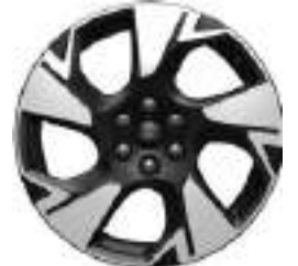
19" OBRĘCZE ZE STOPÓW LEKKICH 1000 zł dla wersji SPORT