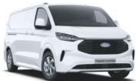
FROZEN WHITE - LAKIER ZWYKŁY bez dopłaty