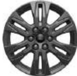
17" OBRĘCZE ZE STOPÓW LEKKICH 550 zł dla wersji LIMITED