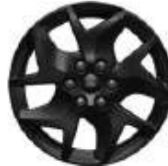
17" OBRĘCZE ZE STOPÓW LEKKICH Standard dla wersji SPORT