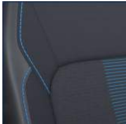
Nowy Ford Transit Custom VAN w wersji Sport z automatyczną skrzynią biegów i tapicerką częściowo skórzaną (Sensico) z niebieskimi akcentami (standard)