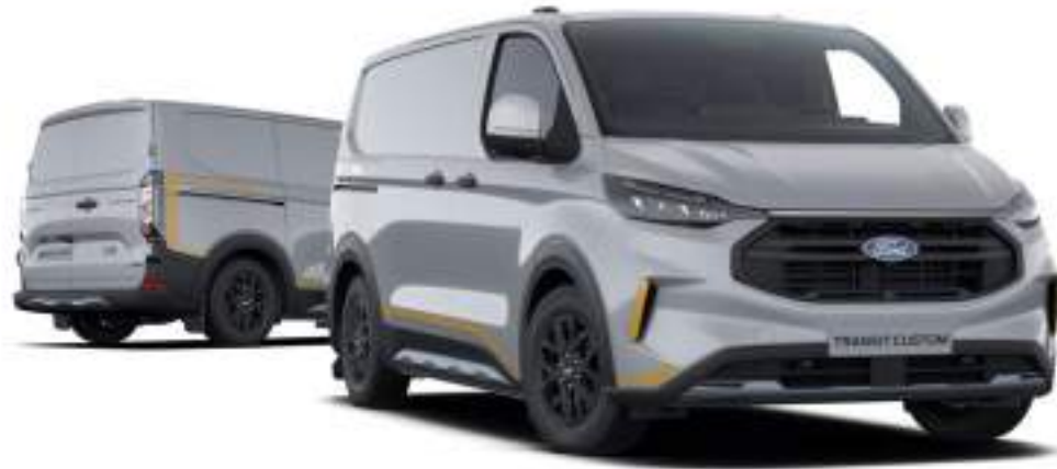
Nowy Ford Transit Custom VAN L1 w wersji TRAIL z lakierem zwykłym -specjalnym Grey Matter (opcja)