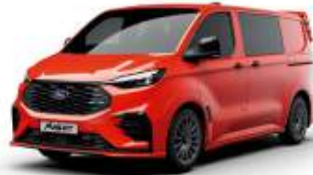
TNT TANGO ORANGE - LAKIER SVO

2 500 zł | lakier dostępny tylko dla wersji MS-RT