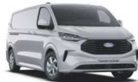
GREY MATTER - LAKIER ZWYKŁY SPECIALNY 2 750 zł | lakier niedostępny dla wersji TREND