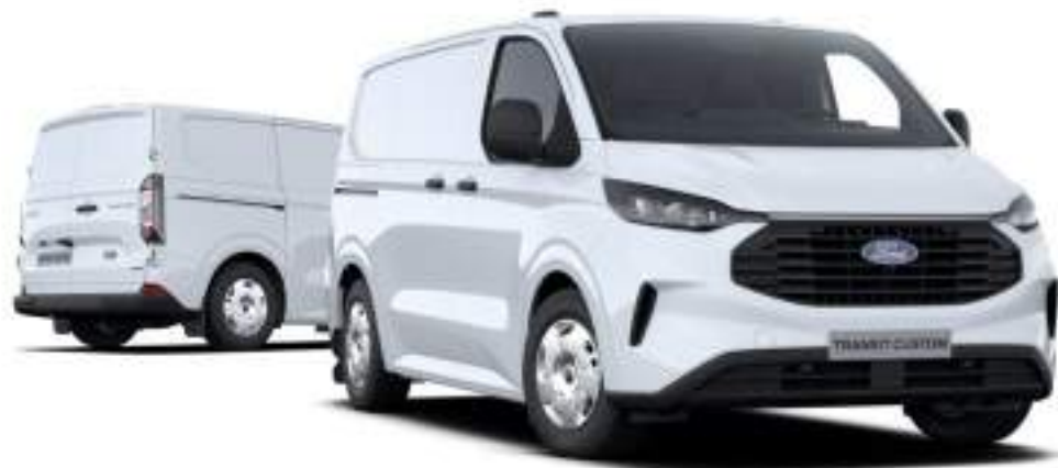
Nowy Ford Transit Custom VAN L1 w wersji Trend z lakierem zwykłym Frozen White (bez dopłaty)