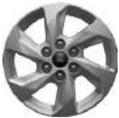
16" OBRĘCZE ZE STOPÓW LEKKICH 450 zł dla wersji TREND Standard dla wersji LIMITED