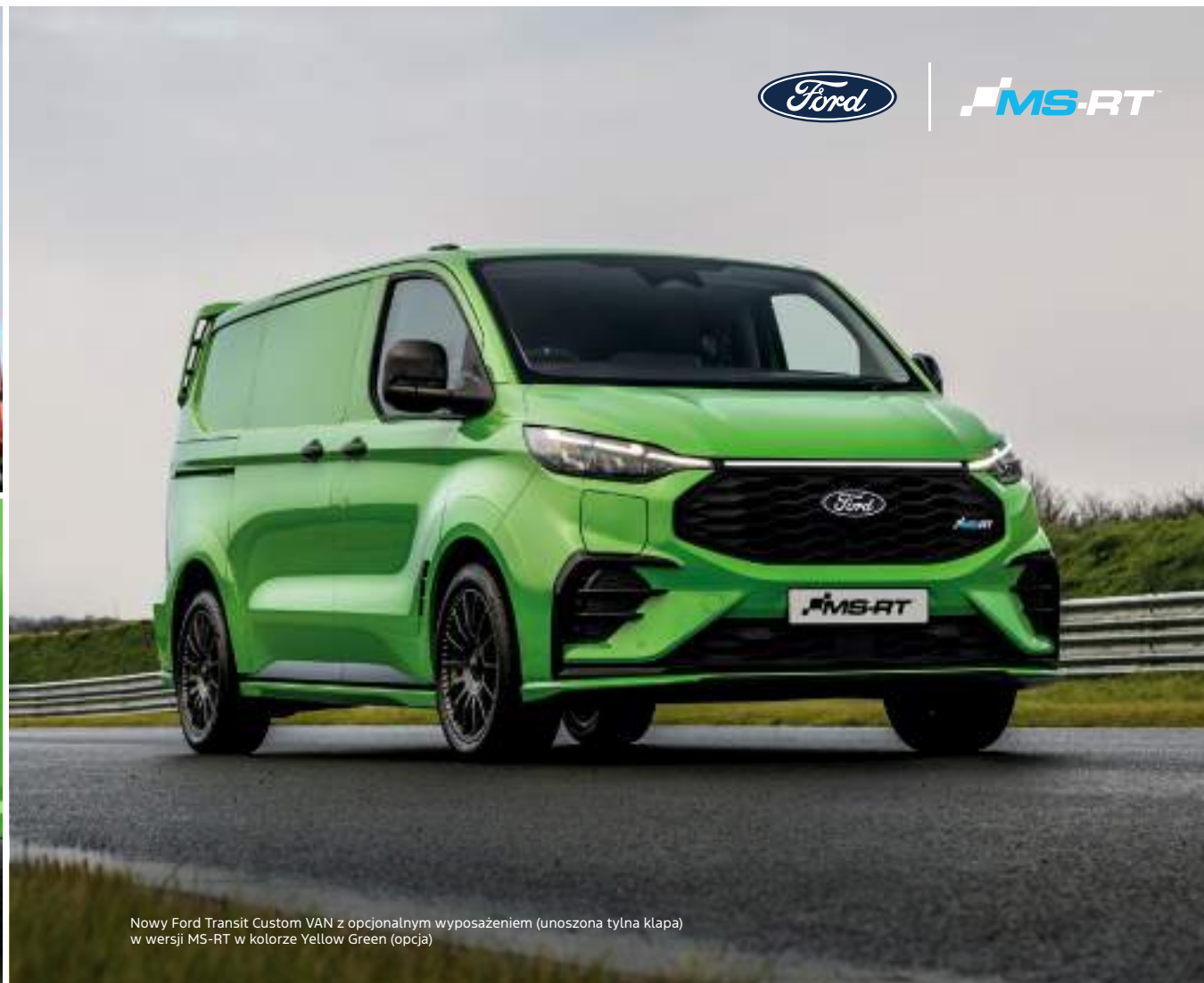
Nowy Ford Transit Custom VAN z opcjonalnym wyposażeniem (unoszona tylna kłapa) w wersji MS-RT w kolorze Yellow Green (opcja)