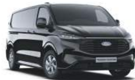
AGATE BLACK - LAKIER METALIZOWANY 2 750 zł