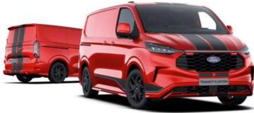
Nowy Ford Transit Custom VAN w wersji Sport z lakierem metalizowanym Artisan Red (opcja)