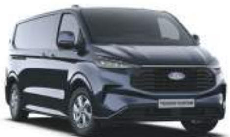
BLAZER BLUE - LAKIER ZWYKŁY bez dopłaty | lakier dostępny tylko dla wersji TREND