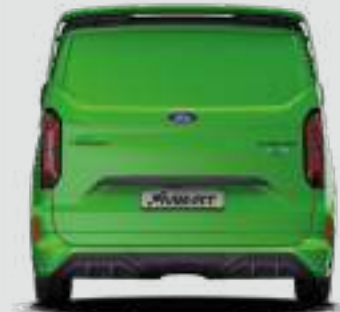
2148 mm (ZE ZŁOŻONYMI LUSTERKAMI)