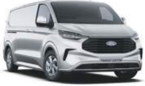
MOONDUST SILVER - LAKIER METALIZOWANY 2 750 zł | lakier niedostępny dla wersji MS-RT