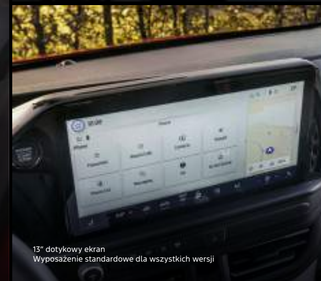
13" dotykowy ekran Wyposażenie standardowe dla wszystkich wersji