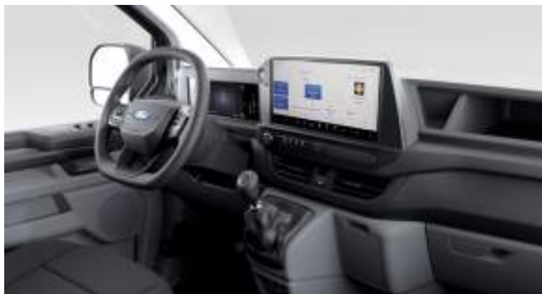
Nowy Ford Transit Custom VAN w wersji Trend z manualną skrzynią biegów i tapicerką materiałową - ciemną (standard)