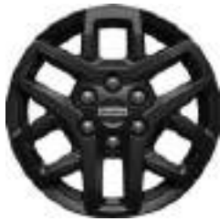
16" OBRĘCZE ZE STOPÓW LEKKICH Standard dla wersji TRAIL