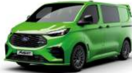
YELLOW GREEN - LAKIER SVO

2 750 zł | lakier niedostępny dla wersji TRAIL. Dla wersji TREND dostępny tylko z napędem elektrycznym