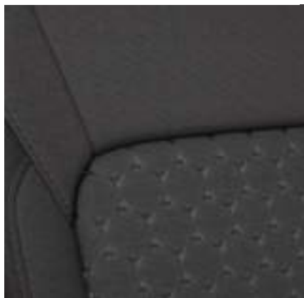
Nowy Ford Transit Custom VAN L1 w wersji LIMITED z automatyczną skrzynią biegów i tapicerką materiałową - ciemną (standard)