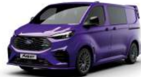
ENW PURPLE - LAKIER SVO

2 500 zł | lakier dostępny tylko dla wersji TREND i MS-RT