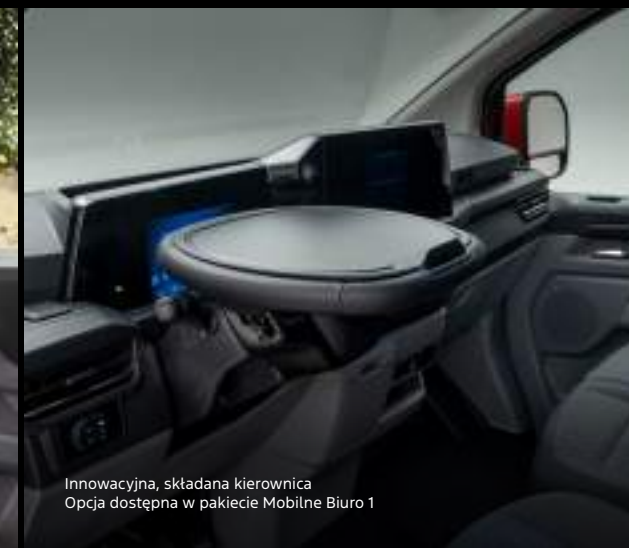
Innowacyjna, składana kierownica Opcja dostępna w pakiecie Mobilne Biuro 1

Nowy Ford Transit Custom VAN w wersji LIMITED z manualną skrzynią biegów, z opcjonalnym wyposażeniem