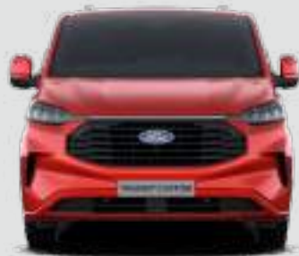
2275 mm (Z LUSTERKAMI)