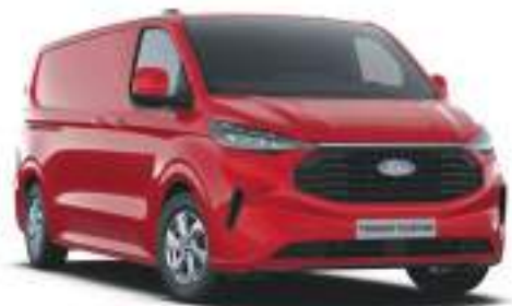
ARTISAN RED - LAKIER METALIZOWANY 2 750 zł | lakier niedostępny dla wersji TREND i TRAIL