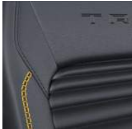
Nowy Ford Transit Custom VAN w wersji TRAIL z automatyczną skrzynią biegów i tapicerką częściowo skórzaną (Sensico) w stylizacji TRAIL - z żółtymi akcentami (standard)