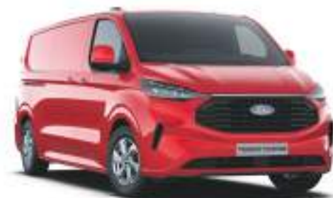
RACE RED - LAKIER ZWYKŁY bez dopłaty | lakier dostępny tylko dla wersji TREND