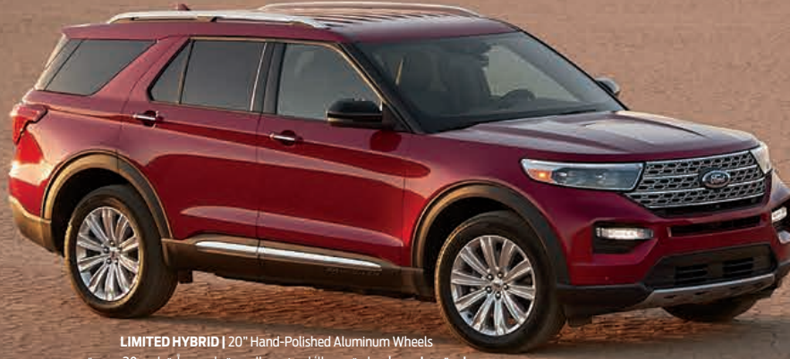
LIMITED HYBRID | 20" Hand-Polished Aluminum Wheels ليمتد هايبريد | عجلات من الألومنيوم المصقول يدوياً قياس 20 بوصة

السيارة الرياضية المتعددة الاستعمالات SUV الأكثر مبيعاً في أميركا. 1 الجديدة كلياً والأفضل من أي وقت مضى.