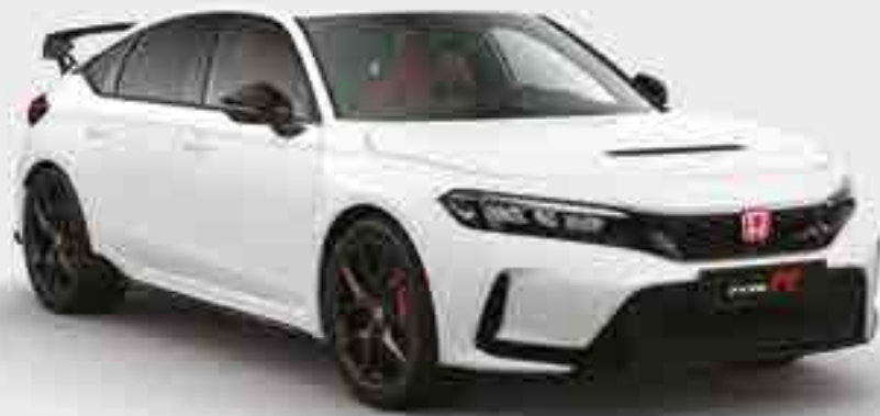
CHAMPIONSHIP WHITE (BLANC CHAMPIONNAT)