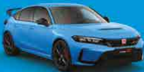
PEARL RACING BLUE