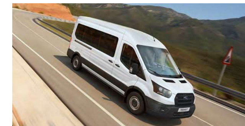
Pacote AdvanceTrac® que entrega mais segurança para o condutor e passageiros.