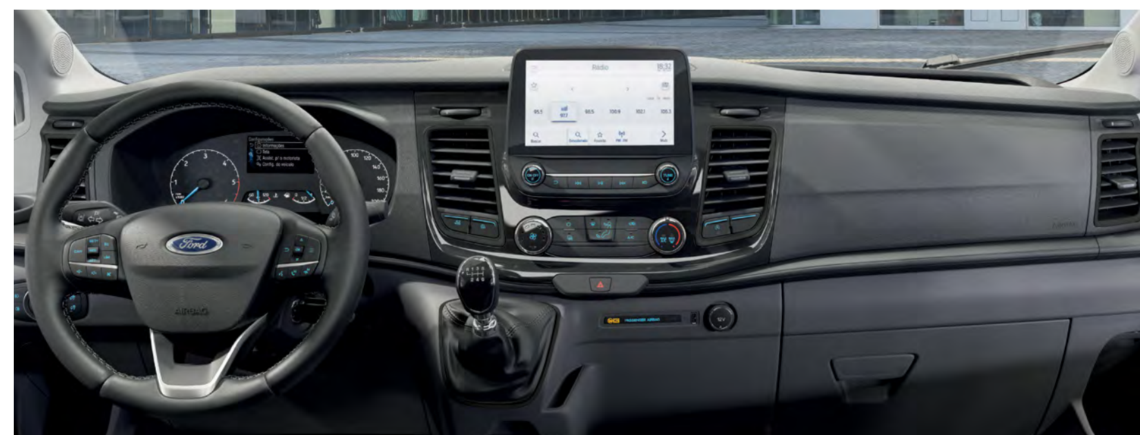
Mais conforto e dirigibilidade em conjunto com o Sync Move e com a opção de transmissão automática.