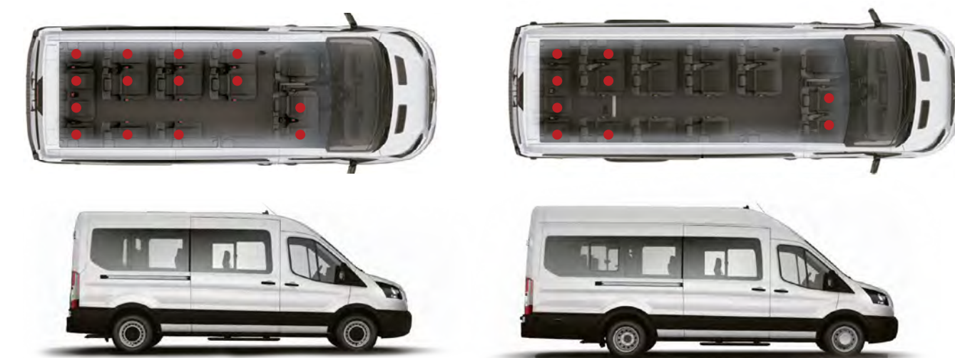
L3H2 versão Minibus com 14+1 lugares e versão Vidrada com 2+1 lugares