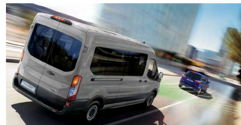
Tecnologias como Piloto automático adaptativo, Assistente de permanência em faixa e direção elétrica fornecem mais produtividade ao seu negócio.

Vidros Elétricos Dianteiros com sistema de abertura / fechamento com um toque para cima / baixo