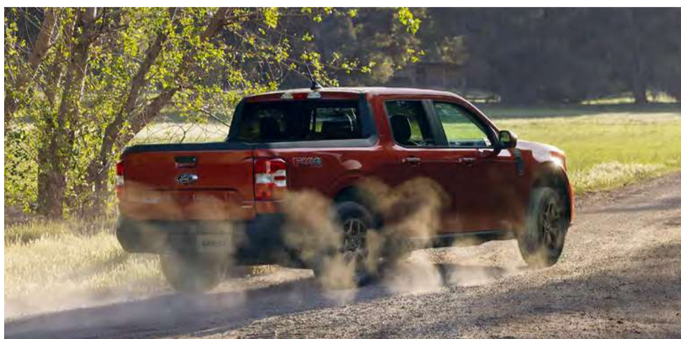
Tração AWD Inteligente