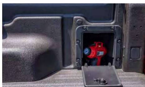
Compartimentos extras nas laterais da caçamba