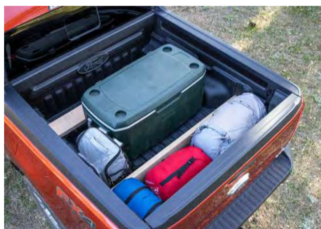
Caçamba inteligente para melhor armazenamento de carga e 8 pontos de fixação