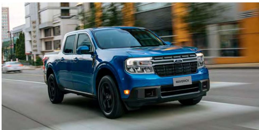
Motor 2.0L EcoBoost de 253 cv e 380 Nm e transmissão automática de 8 velocidades