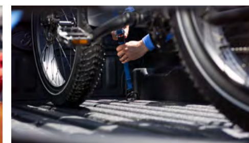
Pontos de fixação na caçamba