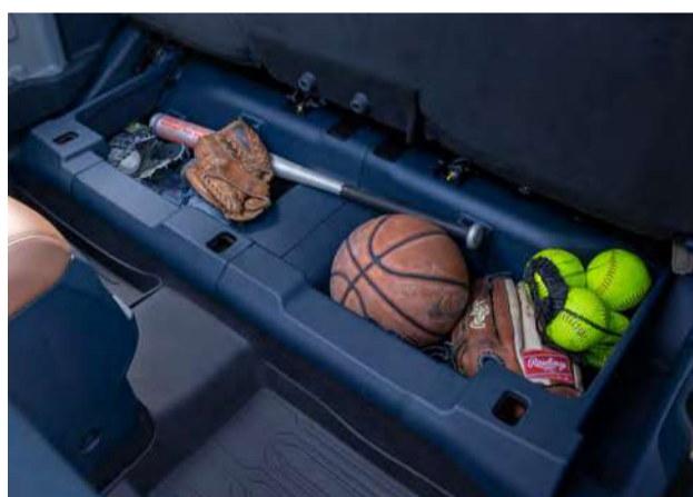
Compartimento extra sob o banco traseiro - 73 litros