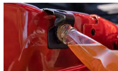
Abridor de garrafas