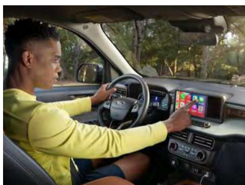
SYNC – Compatível com Android Auto e Apple CarPlay