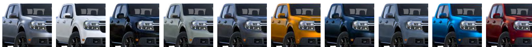
Prata Orvalho - LPM