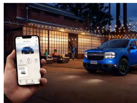
Conectividade via aplicativo FordPass™