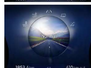
Cinco modos de condução selecionáveis – Normal, Escorregadio, Lama/Terra, Areia e Rebocar/Transp.