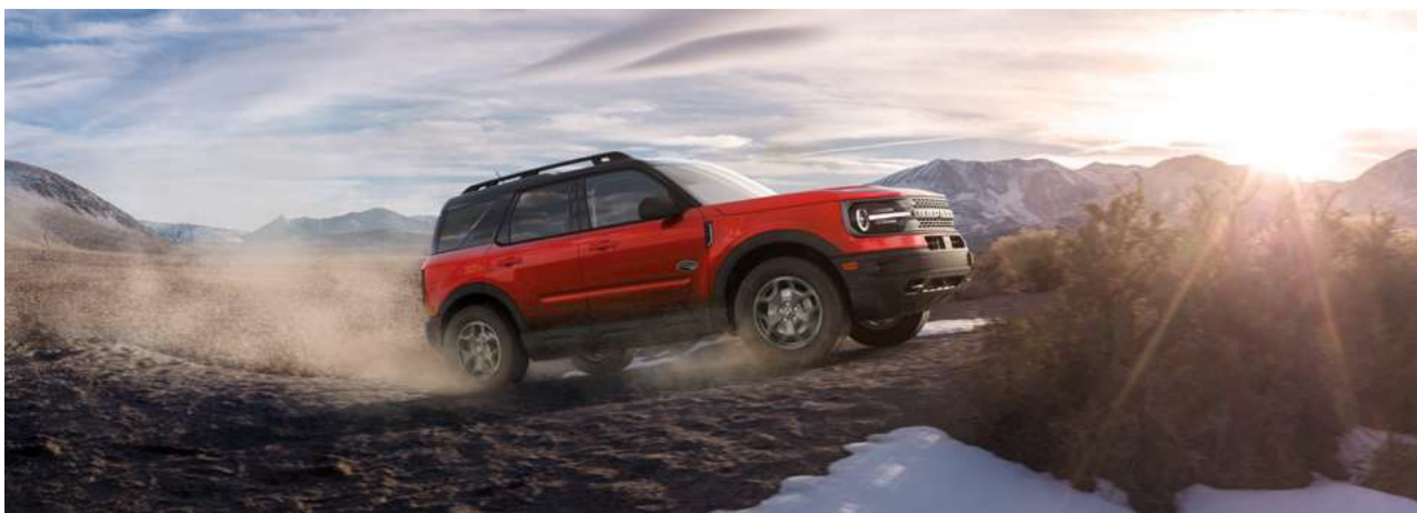
Motor 2.0L EcoBoost com 253 cv de potência e 380 Nm de Torque