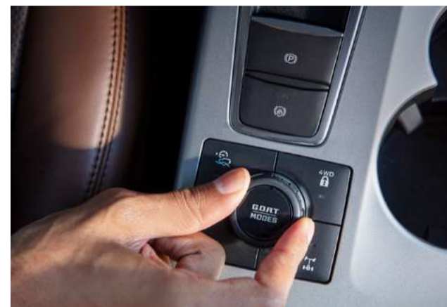
Seletor com 07 tipos de terrenos (G.O.A.T. modes)