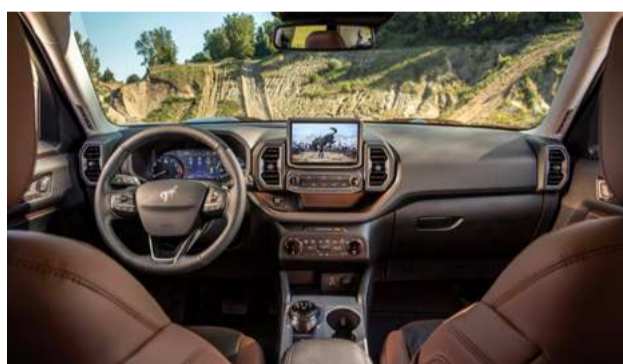
Bancos parcialmente revestidos em couro Ebony / Roast