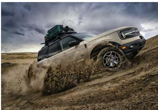
Tração 4x4, diferencial traseiro blocante e vetorização de torque