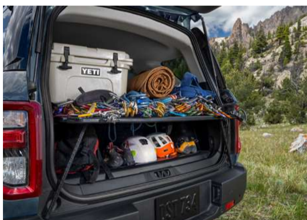
Sistema de gerenciamento de carga com 05 posições diferentes