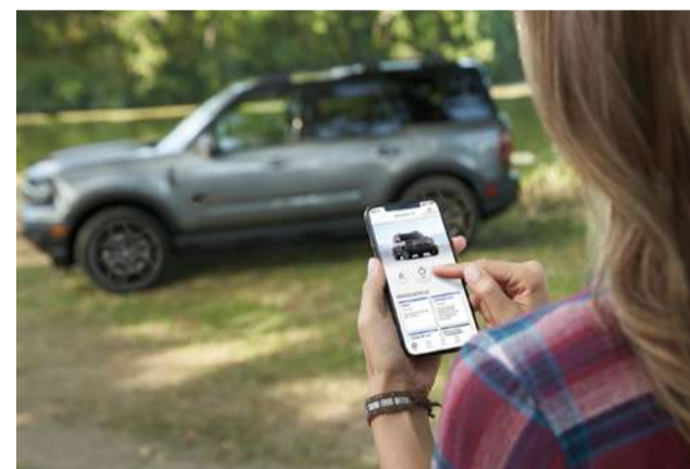
Conectividade via aplicativo Ford Pass™