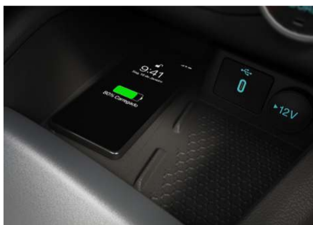
Carregamento de celular por indução