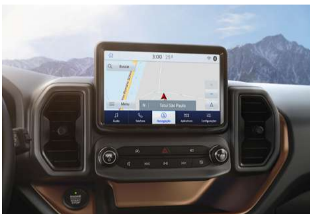
Sync 3 - Compatível com Android Auto e Apple CarPlay